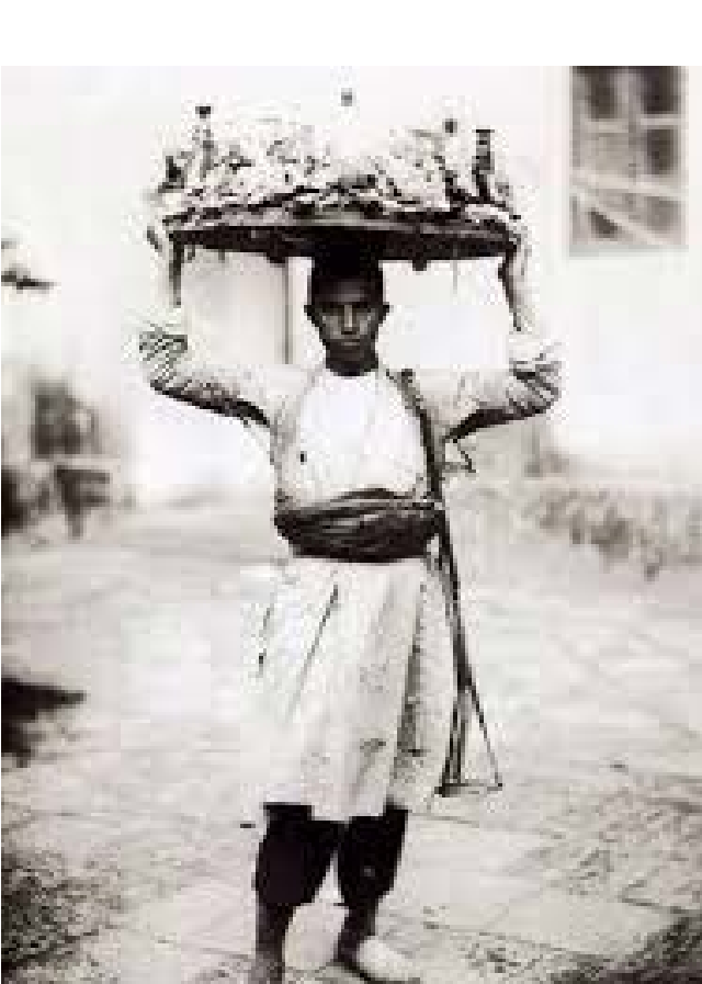
یک زن در حال بردن نان در یک بازار محلی در تهران، ۱۹۰۰

شناخت سفره ایرانی که تاکنون کمتر مورد توجه بوده، مساله ای ضروری است؛ چنان که سال ها پیش زنده یاد استاد عبدالمسین زرین کوب در این باره به زیبایی نوشته بودند: «درباره سوال مشهور مونستیکو و پارسی های کنجکاشو که می پرسیدند «چگونه می توان ایرانی بود؟»، شاید کسی که مثل فویر باخ می پندارد «انسان آن چیزیتست که می خورد» می توانست به آسانی جواب دهد: به وسیله غذای ایرانی، در کنار سفره ایرانی.