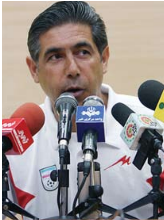
گویا نوشته های مطبوعات زیاد به مذاق شما خوش نیامده؟