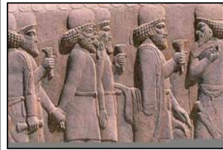
در تصاویر حکاکی شده بر سنگهای تخت جمشید هیچکس عصبانی نیست. هیچکس سوار بر اسب نیست. هیچکس را در حال تعظیم نمی بینید. هیچکس سرافکنده و شکست خورده نیست هیچ قومی بر قوم دیگر برتر نیست و هیچ تصویر خشنی در آن وجود ندارد. از افتخارهای ایرانیان این است که هیچگاه برده داری در ایران مرسوم نبوده است در بین صدها پیکره تراشیده شده بر سنگهای تخت جمشید حتی یک تصویر برهنه و عریان وجود ندارد. بخاطر بسپاریم که از چه نژادی هستیم و دارای چه اصالتی می باشیم.