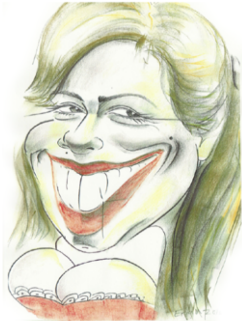
منشی بنگاه راهگشا

کاری متفاوت و کاملاً کمدی و شاد از گروه تایم خنده با کارگردانی علی صادقی