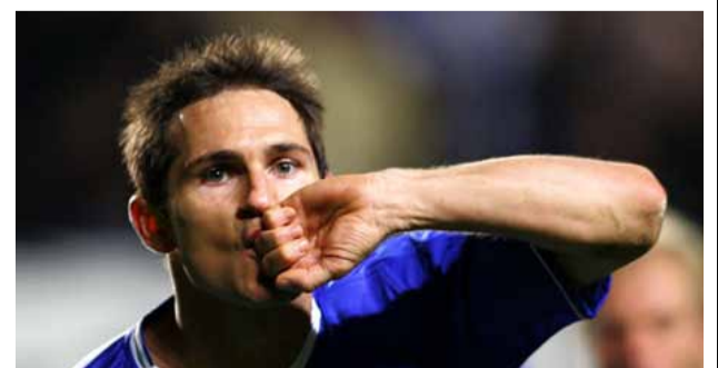
فرانک لمپارد به دلیل بیماری تحت عمل جراحی قرار خواهد گرفت.

اجتماعی این قاره بدل شده است. جدول تازه ای که در مورد تعداد هواداران ورزش ها تنظیم شده و البته برخی کشورهای اروپای غربی و آمریکای شمالی روی آن بحث دارند، رشته ها را این چنین کلاسه بندی می کند: