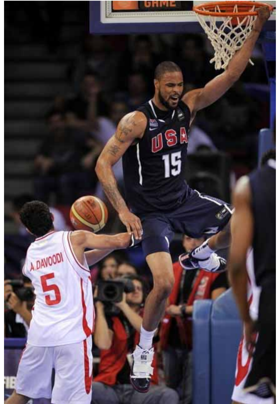
IN BASKETBALL, IRAN EASY FOR U.S. TO HANDLE

In other words, certain countries from Europe and other parts of the world, with the United States in the lead, which could not realize their hostile plot against Iran during the 1980-1988 war with Iraq, are making efforts to create problems for the Islamic Republic by imposing economic sanctions, mounting political pressure, and attempting to increase tension inside the country, he opined. Thus, Iran should be prepared for every imaginable scenario, he added