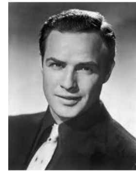
□ مارلون براندو ۱۹۲۴ ۲۰۰۴

سایت معتبر سینه ریوو ۱۰ بازیگر برتر تمام دوران را انتخاب کرده است. البته ستارگان مرد. ترکیبی از ۵ ستاره مدرن - براندو، پاچینو، نیکلسون، دونیرو و نیومن - و ۵ ستاره کلاسیک شامل کری گرانت، جیمز استوارت، همفری بوگارت و هنری فاندنا. انتخاب به گونه ای است که نمی توان اعتراضی به آن کرد. هر ۱۰ نفر از اسطوره های مسلم دنیای سینما هستند. این سایت در مقدمه این انتخاب یک فهرست ۱۰ نفره دوم را نیز منتشر کرده و نوشته که این ۱۰ نفر نیز شایستگی حضور در هر فهرستی از بزرگ ترین ستاره های تاریخ سینما را دارند که در انتهای مطلب این فهرست نیز آورده شده است.