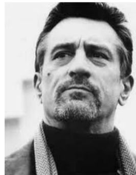
□ رابرت دونیرو ۱۹۴۳

بهترین فیلم ها: محله چینی ها (۱۹۷۴)، دیوانه از قفس پرید (۱۹۷۵)، تاللو (۱۹۸۰) فیلم های مطرح: چند قطعه آسان (۱۹۷۱)، پستچی دوبار زنگ می زند (۱۹۷۹)، پتمن (۱۹۸۹)، بهترین شکل ممکن (۱۹۹۶)