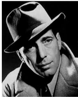
□ همفری بوگارت ۱۸۹۹ ۱۹۵۷

بهترین فیلم ها: مغازه سرنیش (۱۹۴۰)، چه زندگی شگفتی (۱۹۴۶)، پنجره عقبی (۱۹۵۴)، سرگیجه (۱۹۵۸) فیلم های مطرح: آقای اسمیت به واشنگتن می رود (۱۹۳۹)، داستان فیلالدلیا (۱۹۴۰)، مهمیز برهنه (۱۹۵۳)، مردی که لیبرتی والانس را کشت (۱۹۶۱)