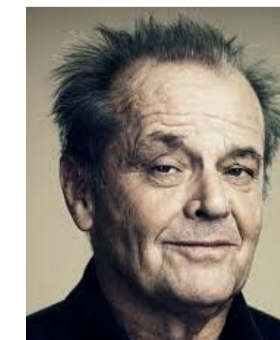
□ جک نیکلسون ۱۹۳۷

بهترین فیلم ها: پدرخوانده (۱۹۷۲)، بعد از ظهر سگی (۱۹۷۵)، صورت زخمی (۱۹۸۴) فیلم های مطرح دیگر: سرپیکی (۱۹۷۲)، پدرخوانده ۲ (۱۹۷۴)، مخصمه (۱۹۹۵)، نفوذی (۱۹۹۹)