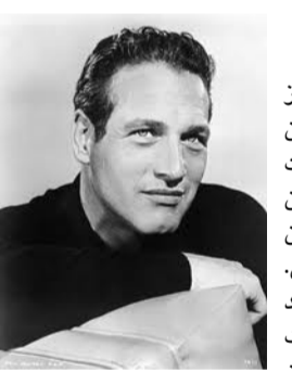
□ پل نیومن ۱۹۲۵ ۲۰۰۸

بهترین فیلم ها: پدرخوانده ۲ (۱۹۷۴)، راننده تاکسی (۱۹۷۵)، گاو خشمگین (۱۹۸۰) فیلم های مطرح: سلطان کمدی (۱۹۸۲)، روزی روزگاری آمریکا (۱۹۸۴)، مخصمه (۱۹۹۵)، کازینو (۱۹۹۶)