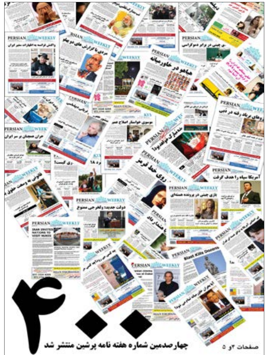
چهار صدمین شماره هفته نامه پرشین منتشر شد

کشورهای اتحادیه اروپا مقصد نهایی بسیاری از این آوارگان است، بخشی از این آوارگان از راه‌های قانونی می‌آید به درخواست پناهندگی می‌کنند که البته با توجه به اینکه کشورهای اتحادیه اروپا به وضعیت بسیاری از آوارگان و بحرانی که