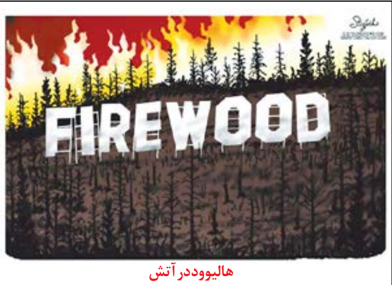
هالیوود در آتش