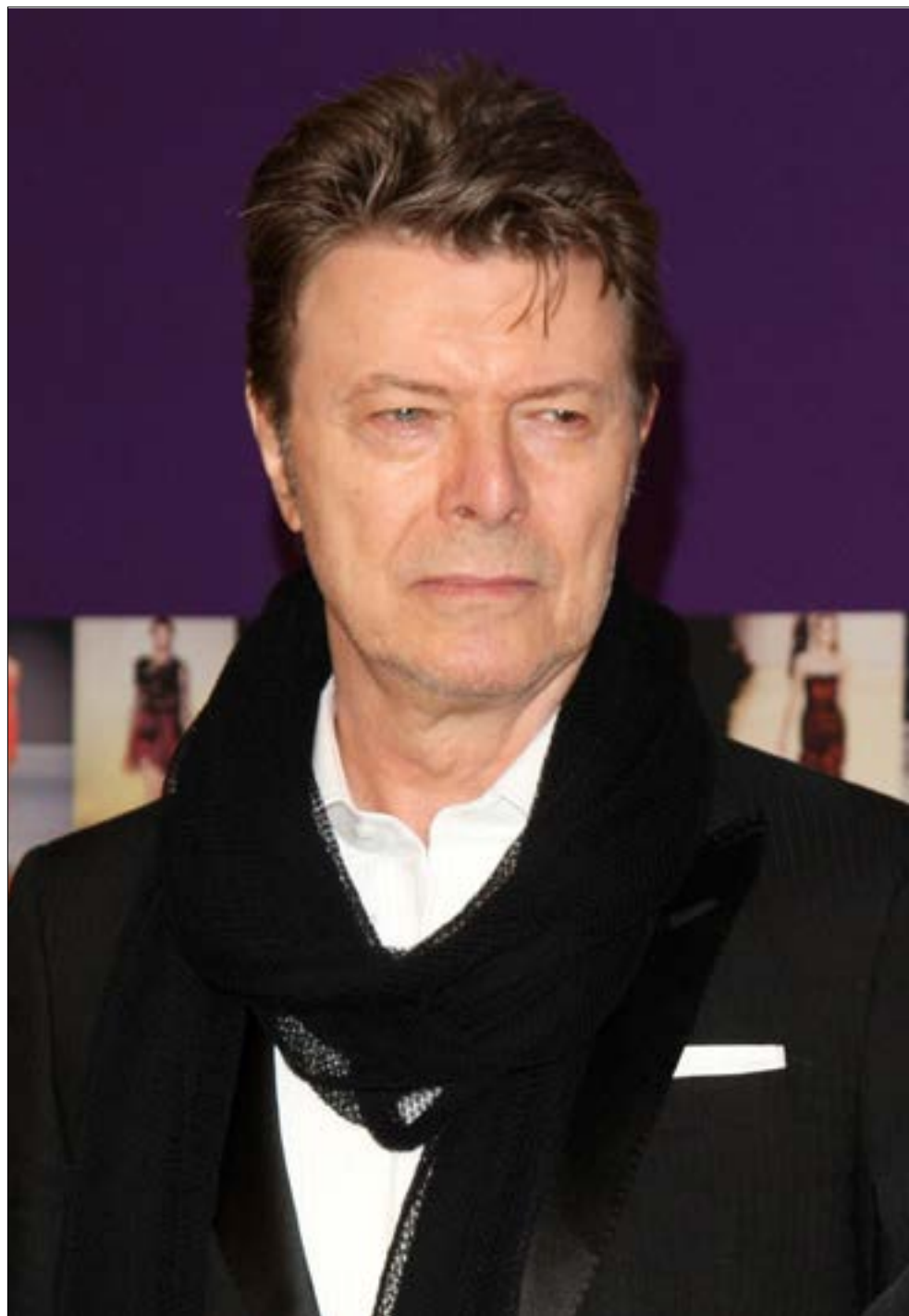
به بهانه درگذشت؛ هنرمند افسانه‌ای انگلستان در سن ۶۹ سالگی

در شرایطی که جهان نفت ارزان را به عنوان عاملی برای رونق اقتصادی تشخیص داده است، ارزانی نفت حکومتداری در کشورهای صادرکننده نفت را با معضلات جدی مواجه کرده است. شواهد تجربی نشان می‌دهد میزان تولید ناخالص داخلی در کشورهای تولیدکننده نفت از جمله روسیه، برخی کشورهای خاورمیانه و شمال آفریقا ممکن است از ۸ تا ۵/۲ واحد درصد در سال‌های پس از افت ۱۰ درصدی قیمت نفت کاهش یابد. با کاهش قیمت نفت و کاهش حجم فعالیت‌های اقتصادی، وضعیت مالی دولت در این کشورها به‌طور مضاعف تنزل می‌یابد. زیرا درآمدهای مالیاتی نیز تحت تاثیر افول فعالیت‌های اقتصادی کاهش می‌یابد. قیمت سر به سری نفت برای تامین هزینه‌های مالی دولت در محدوده ۵۴ دلار در کویت تا ۱۸۴ دلار در لیبی به ازای هر بشکه نفت برآورد می‌شود که قیمت‌های فعلی بسیار پایین‌تر از این محدوده است. در برخی کشورها فشار هزینه‌های دولتی در دوران کاهش قیمت ممکن است با منابع صندوق ثروت ملی جبران شود. اما بسیاری از صادرکنندگان نفتی از جمله ایران با محدودیت جدی در ذخایر ارزی مواجه هستند و ناگزیر به کاهش ارزش پولی یا محدودیت در واردات خواهند شد. در میان کشورهای صادرکننده نفت ایران در شرایط بسیار دشواری قرار گرفته است. تحریم‌ها هزینه اقتصادی بسیار هنگفتی به اقتصاد ایران تحمیل کردند و منابع ارزی کشور در این دوره به شدت تنزل یافت. اکنون که انتظارات در جهت ترمیم و شروع زودرس رونق اقتصادی شکل گرفته است، کاهش شدید